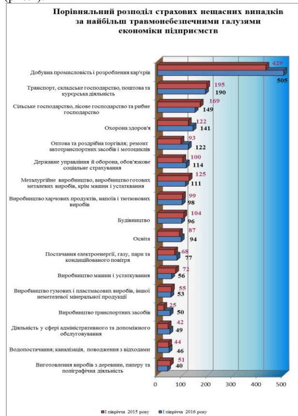
Рис. 2. Порівняльний розподіл страхових нещасних випадків за найбільш травмонебезпечними галузями економіки підприємств / Comparative distributing of

Значно збільшилась кількість страхових нещасних випадків із смертельним наслідком у: Волинській області - на 8 випадків, або у 3,7 разів (з 3 до 11), Рівненській та Черкаській областях - на 6 випадків, або у 7 разів (з 1 до 7), м. Києві - на 5 випадків, або 71,4% (з 7 до 12). Значне зниження страхових нещасних випадків відмічається у: Закарпатській області - 45,0% (з 20 до 11), Івано-Франківській області - на 30,8% (з 39 до 27), Чернігівській області - на 22,2% (з 63 до 49), Сумській області - на 19,0% (з 58 до 47) (рис.2).