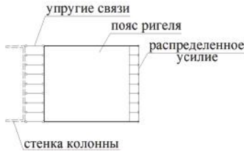
Рис. 2. Расчетная модель.

По результатам расчета строится эпюра распределения напряжений по оси действия усилия.