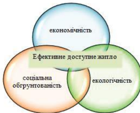
Рис. 1 Модель поєднання критеріїв ефективності доступного малоповерхового житла

Одержуваний економічний ефект при застосування технології дерев'яного каркасного домобудівництва з використанням місцевих матеріалів при зведенні екологічного доступного житла обумовлений такими факторами: короткими термінами монтажу, легкості конструктивних елементів, високими теплотехнічними характеристиками (рис. 2).