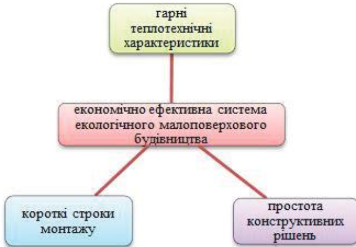
Рис. 2. Основні елементи економічної ефективності екологічного малоповерхового будівництва з місцевих матеріалів

Економічна ефективність житла в процесі експлуатації може бути досягнута шляхом зниження витрат на опалення, тобто зменшенням або приведенням до нуля питомих теплових втрат будівлі в опалювальний період.