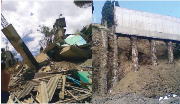
Рис. 1. Разрушение свайной удерживающей конструкции в г.Алушта в 2011 г.

Основной материал. В практике сформировались и развиваются такие основные методы расчета надземных строительных конструкций и сооружений на прогрессирующее разрушение, как [2]: