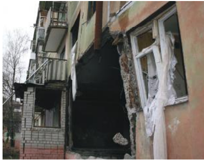
Рис. 2. Отклонения от проектного положения и обрушение трехслойных стеновых панелей и плит перекрытий в панельном здании серии 1-464 А.

Изложение материала исследований. При создании конструктивного решения ригеля сталебетонного перекрытия за основу принята система сборного перекрытия «Дельта Балки» [5]. Основными недостатками «Дельта Балки» является односторонний шов соединения стенки и нижней полки, на которую опираются многопустотные железобетонные плиты, повышенный расход стали на верхний пояс значительной толщины, заполнение бетоном пространства между стенками в растянутой зоне, что приводит к увеличению веса «Дельта Балки».