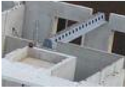
Рис. 1. Установка сталебетонной балки в крупнопанельном здании с последующим монтажом на балку пустотных плит [1].

Постановка проблемы. В последнее время большое внимание уделяется программе «доступное жилье» не исключено, что в обозримом будущем технологии панельного домостроения отечественные и финские будут активно использоваться в Украине [1]. Ожидается, что такие дома мотут появиться в конце 2013 года.