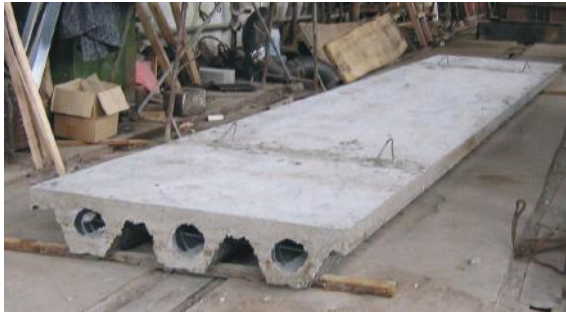
Рис. 4. Пустотноребристая плита размером 1,0 х 6,0 м после изготовления и распалубки.

Пустотноребристые плиты приведены на рис. 4. В качестве пустообразователей использованы картонные трубы. Промышленные испытания пустотноребристых плит проведены на сертифицированном оборудовании в ЭКБ НИИСК. Разработанное конструктивное решение многопустотной ребристой плиты защищено декларационным патентом Украины [6].