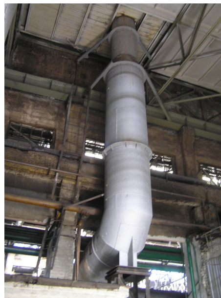
Рис 2. Общий вид металлической дымовой трубы внутри цеха/General view of the metal chimney inside the shop.

металлическая труба при помощи вертикальных ребер жесткости приварена к опорной плите металлической опоры.