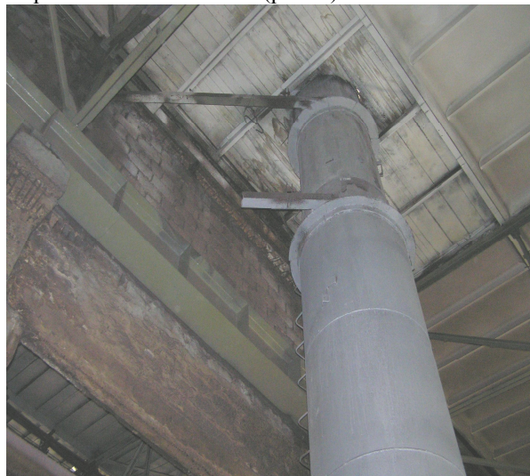
Рис 4. Две распорки на отм. +10.800 (в уровне подкрановой балки) вырезаны /Two struts at elevation +10.800 (In the level of crane beams), cut

В результате обследования установлено, что на отм. +10.800 вырезаны одна из двух распорок в креплении одной трубы и две из двух в креплении 2-х труб. То есть, на отм. +10.800 три из пяти труб не раскреплены из плоскости (рис. 4).