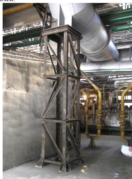
Рис 3. Труба опирается на пространственную металлическую опору/The pipe rests on the metal support spatial

Элементы сквозной опоры (вертикальные пояса и решетка) изготовлены из уголков 100x10мм, фасонки – из листа толщиной 10мм, размеры опоры в плане – 900x900мм (рис. 3). Металлическая опора при помощи анкерных болтов закреплена в железобетонном монолитном фундаменте. По верхнему обрезу фундамент имеет размеры – 1200x1200мм.