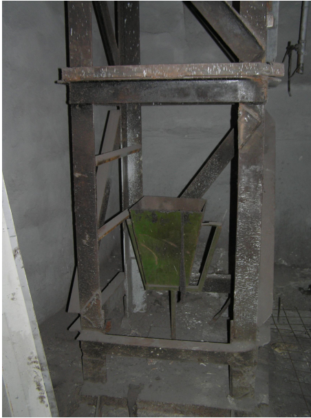
Рис 5. Элемент решетки сквозной опоры вырезан /The element of the lattice cut-through support

По результатам детального обследования металлических дымовых труб – определения фактического состояния элементов раскрепления труб, коррозионного износа труб и с учетом действующих на настоящий момент нагрузок – был проведен проверочный расчет с помощью проектно-вычислительного комплекса SCAD 11.3.