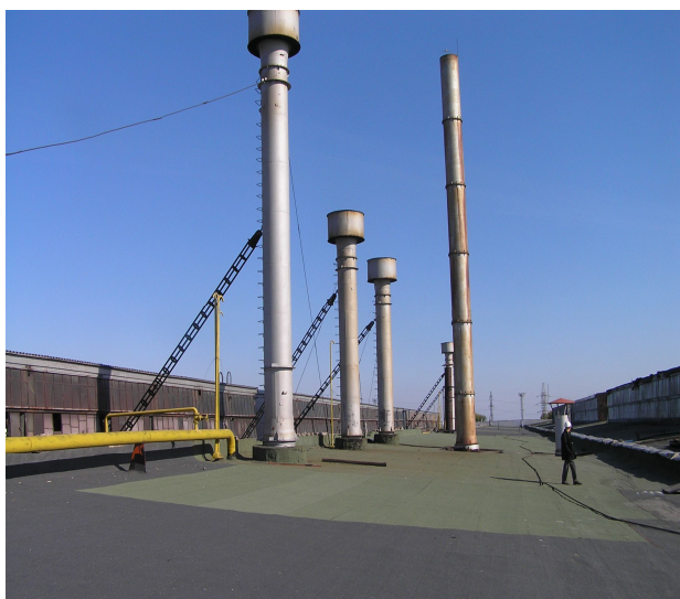
Рис 1. Общий вид металлических дымовых труб секционных печей трубoproкатного цеха № 1/

труб – 5мм. Стволы всех дымовых труб с отм. +6.765 до отм. +10.765 и с отм. +11.40 до отм.+25.00 – цилиндрического очертания с внутренним диаметром труб 1170мм и 1000мм соответственно.