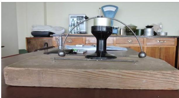
Рис. 1. Определение влажности глинистого грунта на границе текучести при помощи балансного конуса / Determination clay soil moisture on the border of liquid limit by means of balancing cone

Кроме того, грунтобетонная смесь приготавливалась в высокоскоростном смесителе-активаторе роторного типа следующим образом (в табл. 2, состав № 2): глинистый грунт и цемент послойно в два приема загружались в емкость аппарата, включалась установка и постепенно в течение 20 с добавлялось 25 % воды от рассчитанного количества воды затворения. Всего время обработки смеси составляло 25-35 с. Далее смесь выгружалась в подготовленную емкость смесителя принудительного действия, где она домешивалась с оставшимся количеством воды затворения в течение 3 мин. Активированная грунтобетонная смесь разогревалась до температуры 40-43 °С. Это происходит вследствие действия больших скоростей обработки и за счет трения материалов различного размера и плотности. Скорость вращения ротора смесителя-активатора составляла 12 м/с.