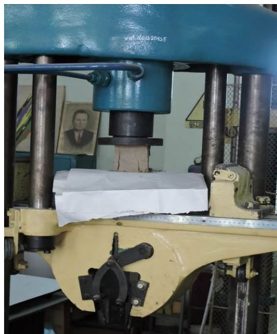
Рис. 2. Испытание образца грунтобетона на прочность при сжатии на гидравлическом прессе УММ-20 / Compressive strength test of soil-concrete sample by means of hydraulic press

Через 28 суток, а для некоторых составов грунтобетона и через 7 суток естественного твердения образцы извлекались из камеры нормального твердения и в течение 4 часов испытывались на прочность при сжатии на гидравлическом прессе марки УММ-20 (рис. 2). Кроме того, определялась средняя плотность образцов грунтобетона по методике, описанной в ДСТУ Б В.2.7-170:2008 [6].