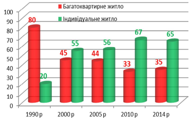
Рис. 1. Динаміка росту індивідуального житла України, % до загального об'єму будівництва / Dynamics of growth of individual housing Ukraine, % of the total volume of construction

Питома вага всіх енергозатрат та надходжень енергії від відновлювальних джерел визначає загальний баланс енергоефективності споруди (див. табл. 2). Розрахунки такого балансу енергетичних показників мають враховуватися на стадії розробки робочого проекту будинку.