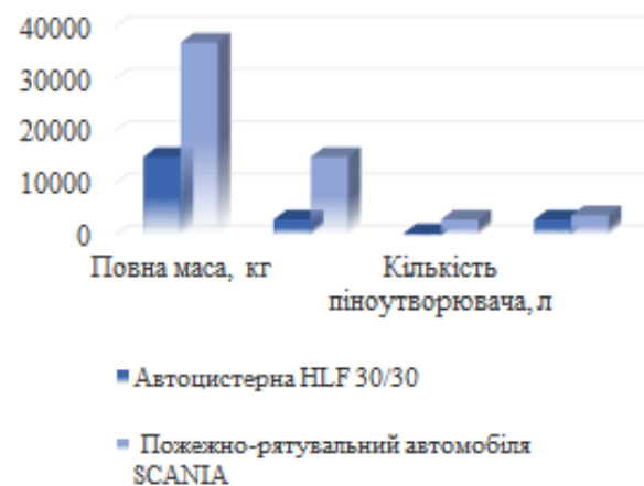
Рис. 1 Порівняння технічних характеристик АРА SCANIA та автоцистерни HLF 30/30 / Comparison of the technical characteristics of the ERC SCANIA and the HLF 30/30 Tankers

Отже всі види АРА мають високу надійність для забезпечення рятувальних робіт та комплектуються спеціальним обладнанням в залежності від природи НС. В Україні, відповідно до проведеного аналізу, застосовується АРА, серед яких важко обрати універсальну машину, для всіх видів аварій та НС. На рисунках 1 та 2 наводиться порівняння деяких технічних характеристик розглянутих у роботі прикладів АРА.