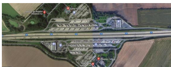
Рис. 2. Dresdener Tor - пример основного способа расположения объектов транспортной инфраструктуры Германии / Dresdener Tor - example of the main way the location of the transport infrastructure in Germany

Данное значение усреднено, так как на некоторых объектах возможно колебание в пределах 1го рабочего места.