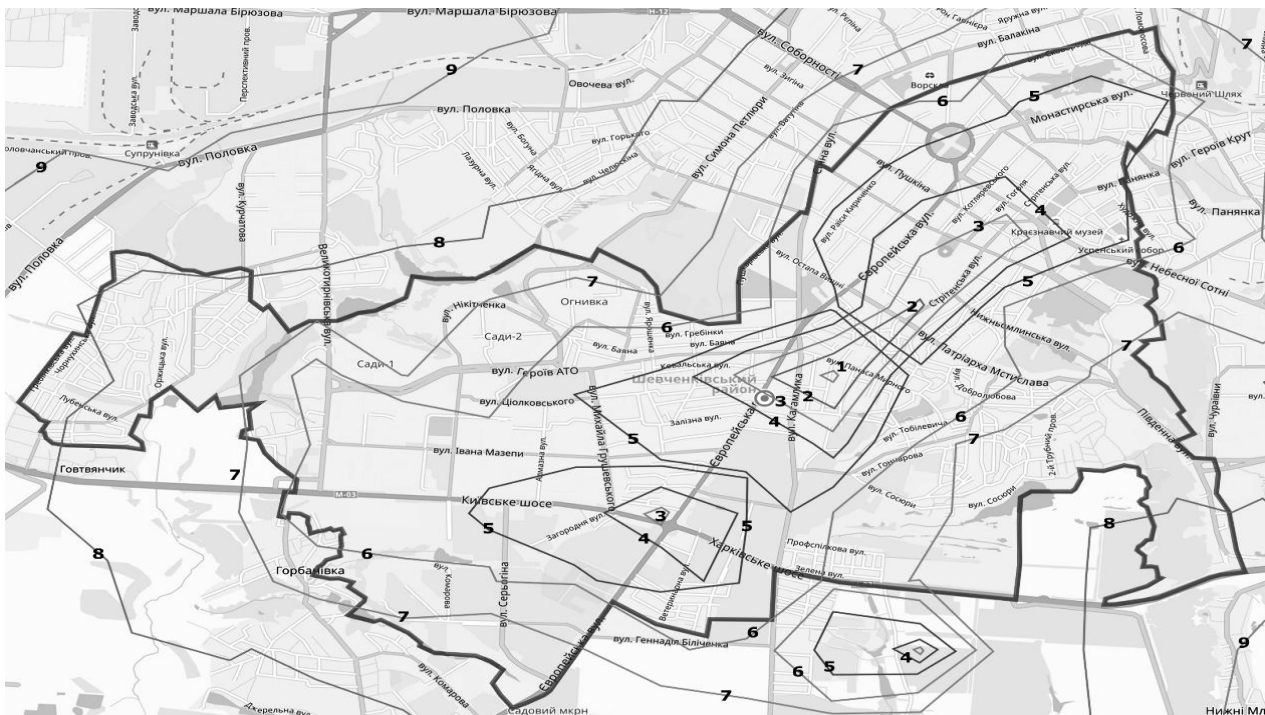
Рис. 3. Карта розсіювання викидів NO 2 від автотранспорту (рівень потенційного ризику для здоров'я людей): 1 – 20,34 ГДК (Risk – 0,812); 2 – 18,1 ГДК (Risk – 0,775); 3 – 15,85 ГДК (Risk – 0,729); 4 – 13,61 ГДК (Risk – 0,674); 5 – 11,37 ГДК (Risk – 0,608); 6 – 9,12 ГДК (Risk – 0,528); 7 – 6,88 ГДК (Risk – 0,432); 8 – 4,63 ГДК (Risk – 0,317); 9 – 2,39 ГДК (Risk – 0,179) / Dispersion map of NO 2 emissions from motor vehicles (level potential risk for human health): 1 – 20,34 MAC (Risk – 0,812); 2 – 18,1 MAC (Risk – 0,775); 3 – 15,85 MAC (Risk – 0,729); 4 – 13,61 MAC (Risk – 0,674); 5 – 11,37 MAC (Risk – 0,608); 6 – 9,12 MAC (Risk – 0,528); 7 – 6,88 MAC (Risk – 0,432); 8 – 4,63 MAC (Risk – 0,317); 9 – 2,39 MAC (Risk – 0,179)