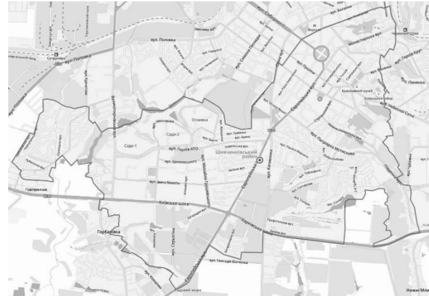
Рис. 1. Територія проведення дослідження інгредієнтного забруднення та оцінки ризику здоров'ю населення від впливу викидів автотранспорту Шевченківського району міста Полтава/ Territory of conducting research on contaminated and estimating the risk to public health from the impact of motor vehicle emissions in the Shevchenkivskyi district of Poltava

фактичні концентрації забруднюючих речовин в атмосферному повітрі району.