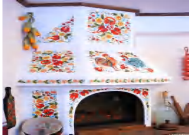
Рис. 6. Традиційна українська піч в інтер'єрі заміського будинку / Traditional Ukrainian stove in vacation home

Найбільш аутентичним український національний стиль виглядає в екстер'єрі й інтер'єрі заміського будинку або дачі. Тут є можливість створити традиційну піч, відповідно оформити подвір'я тощо.