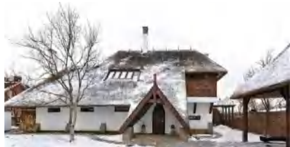
Рис. 7. Приватна садиба в українському стилі, м. Дніпро, поч. XXI ст. / Ukrainian style at Private farmstead, Dnipro, the beginning of the 21st c.

Чудово ілюструє описані принципи, наприклад, особняк, нещодавно збудований у м. Дніпро за проектом місцевих молодих дизайнерів. Він представляє собою сучасну садибу, виконану в традиційному українському стилі. Авторам новаторського архітектурного проекту вдалося природним чином переосмислити канонічний тип традиційної української мазанки і дати їй нове життя. У споруді вдало поєднали давню народну архітектуру з сучасними методами й рішеннями в дизайні комфортного житла. Зовні дах будинку покритий очеретом, а стіни пофарбовані в білий колір, що робить будинок схожим на українську хату.