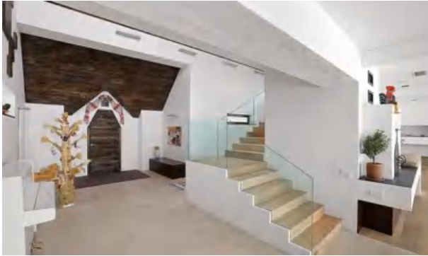
Рис. 8. Приватна садиба в українському стилі, м. Дніпро, поч. XXI ст. Фрагмент 1 поверху /

Ukrainian style at Private farmstead, Dnipro, the beginning of the 21st century. Fragment of 1 floor