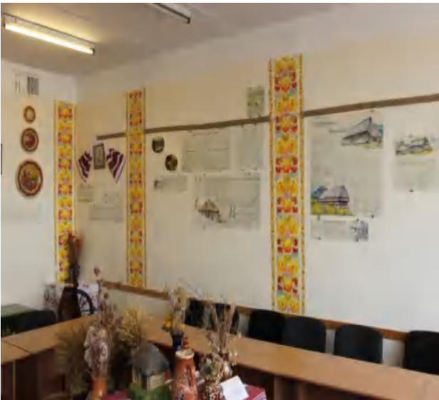
Рис. 5. Петриківський розпис в інтер'єрі навчальної аудиторії ДВНЗ ПДАБА, м. Дніпро

Petrikivsky painting in a modern living quarters