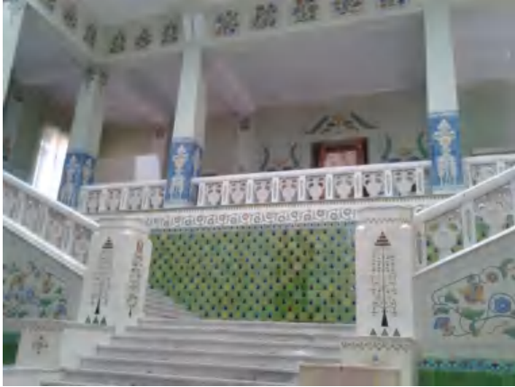
Рис. 1. Будинок Полтавського губерньського земства House Poltava province zemstvo

найскравішим прикладом українського архітектурного стилю став будинок Полтавського губерньського земства (нині Потавський краєзнавчий музей), споруджений у 1903 – 1908 рр. за проектом В. Г. Кричевського і розписаний всередині С. І. Васильківським і М. С. Самокишем [6].