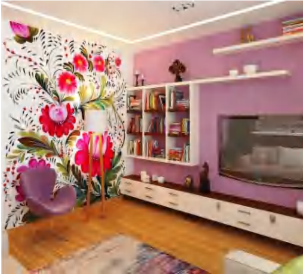
Мал. 4. Петриківський розпис в сучасному інтер'єрі житлового приміщення

Petrikivsky painting in a modern living quarters