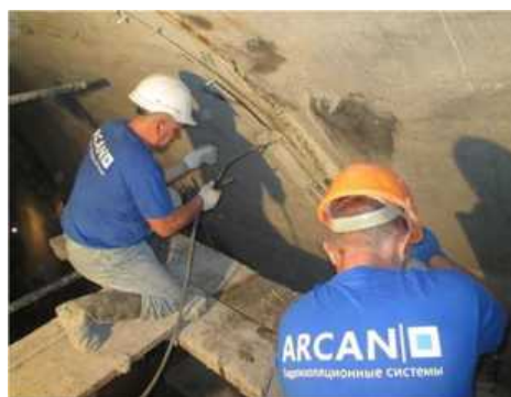
Рис. 4 Производство работ по герметизации трещин / Work on the sealing of cracks