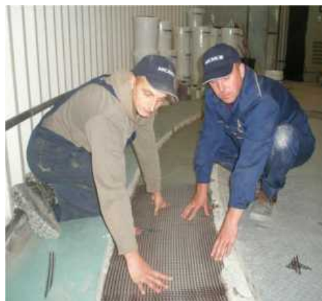
Рис. 3. Ремонт и усиление перекрытия шахты гидроагрегата № 1 / Repair and reinforcement of the overlapping of the mine of hydroelectric № 1