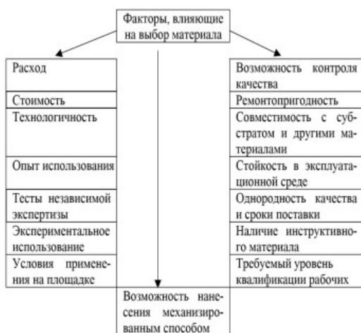
Рис. 4. Факторы, влияющие на выбор материала / Factors influencing the choice of material

Параметр качества обеспечивается за счет таких характеристик: