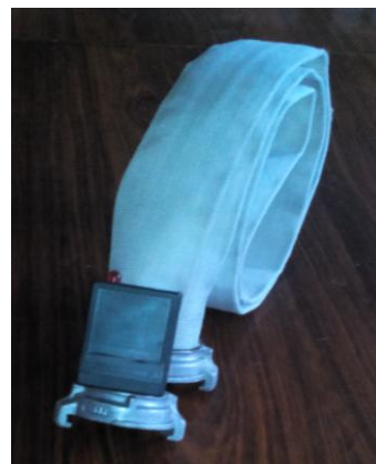
Рис. 4. Пожежний рукав з сигнализатором напруги у складеному вигляді/Fire sleeve with voltage signal in the folded form

Після виконання герметизації та фіксації з'єднувальних головок. На пожежний рукав встановили сигнализатор напруги в корпусі. Провідники від з'єднувальних головок приєднали до сигнализатора напруги.