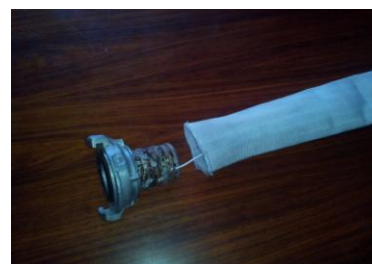
Рис. 3. - З'єднувальна головка з провідником прокладеним всередині пожежного рукава/ The connecting head with the conductor is laid inside the fire hose

головки проклали в середині пожежного рукава (рис.3.).